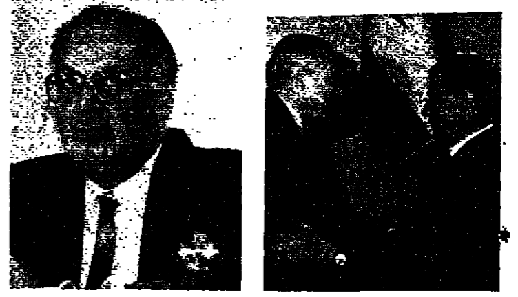
الموفد الفرنسي مع عون (دالاي ونبرا) الحص خليل مومنة صحدي